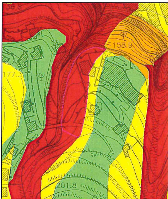
STRALCIO DEL PSAI – CARTA DELLA PERICOLOSITA' DA FRANA VIGENTE