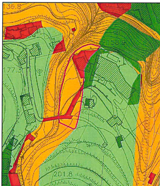
STRALCIO DEL PSAI – CARTA DEL RISCHIO DA FRANA VIGENTE